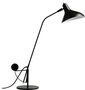
Table lamp | Lampe de table